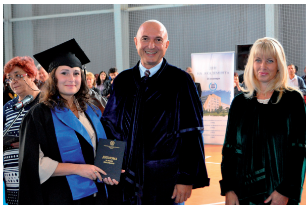
При връчване на дипломи

и "Методист по масово – оздравителна и лечебна физкултура". През същата 1947 год. е основана първата катедра "Лечебна физкултура, масаж, спортна травматология и първа медицинска помощ", с ръково-