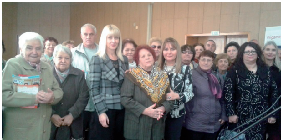
Колективна снимка на участниците в обучението, проведено в Дома на науката и техниката в гр. Гоце Делчев.